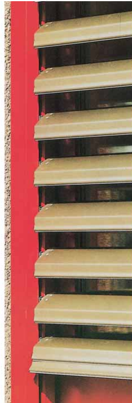
Posición de bajada