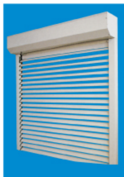
Kit persiana graduada

SUPER-BLOC , es un conjunto en aluminio de persiana enrollable-orientable SUPER GRADHERMETIC y cajón de registro con todos los mecanismos necesarios para ser instalado, sin trabajos de albañilería.