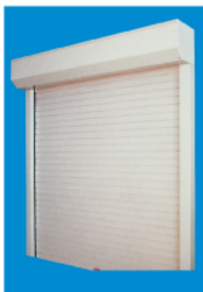
Kit persiana cerrada