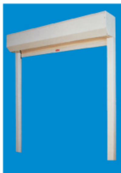
Kit persiana subida